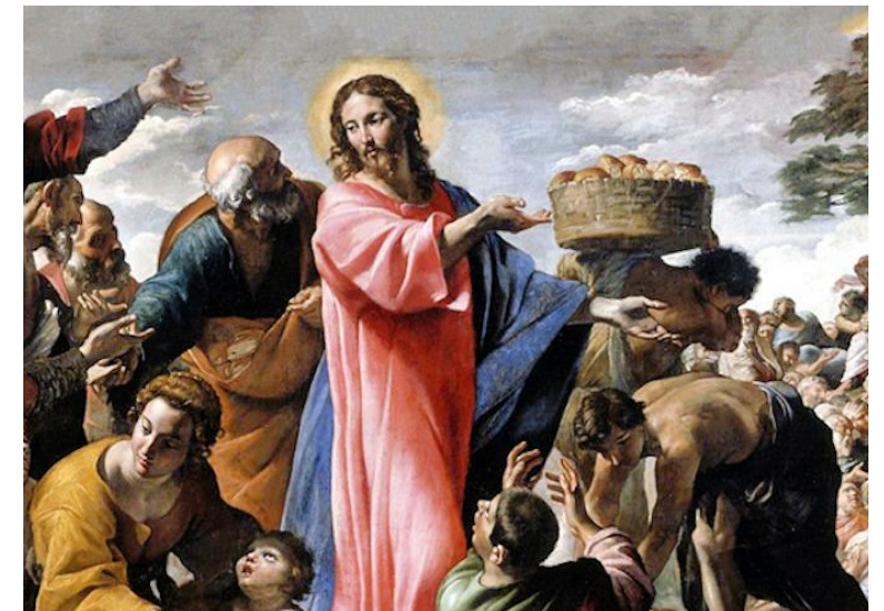
« Ils distribua les pains aux convives, autant qu'ils en voulaient » (Jean 6, 1-15)

17ème Semaine du Temps Ordinaire - année B