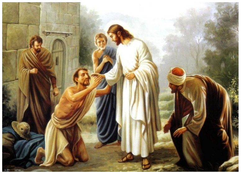
« Il fait entendre les sourds et parler les muets » (Mc 7, 31-37).