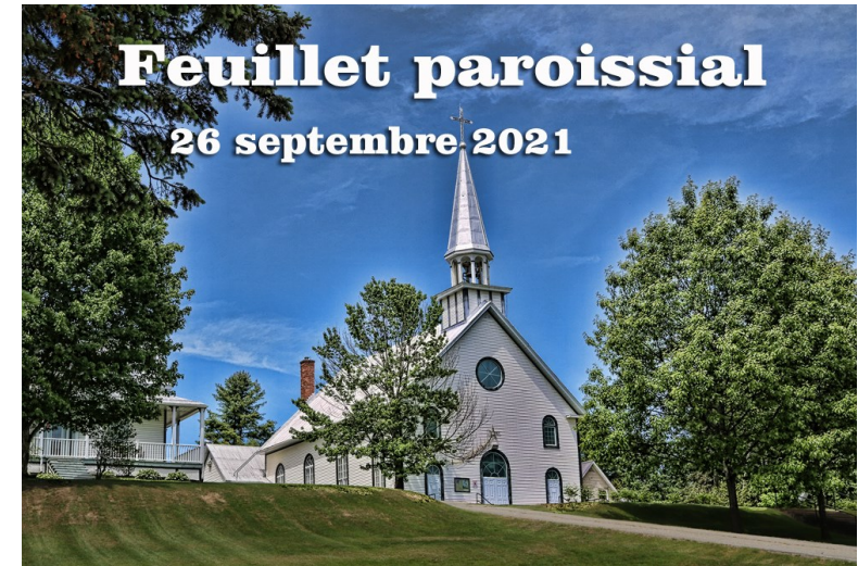
PAROISSE SAINT-STANISLAS-DE-KOSTKA D'ASCOT CORNER

5661, rue Principale, Ascot Corner, QC J0B 1A0 Secrétariat: Tél 819-562-6468 Fax 819-562-6468 Courriel: paroissesaint-stanislas@videotron.ca